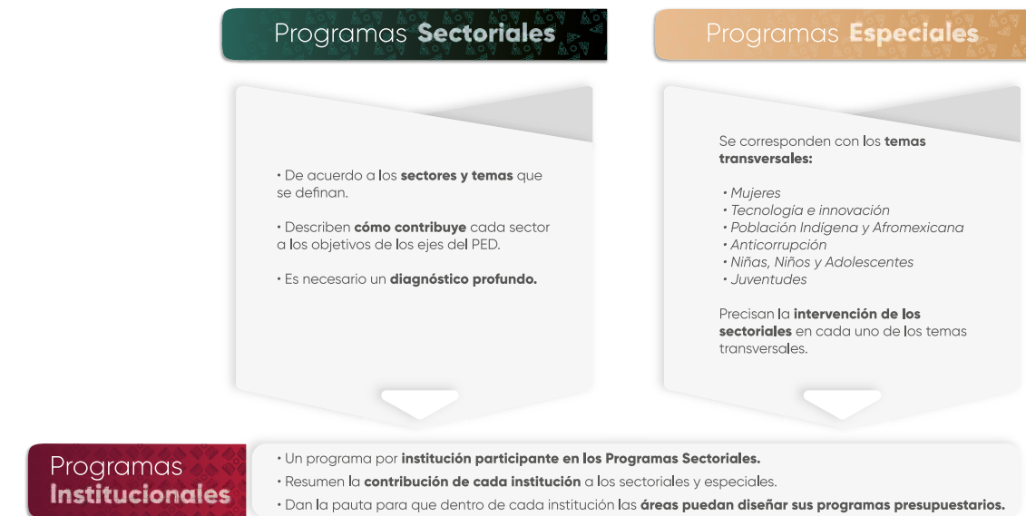
Esquema 1. Estructura de los Programas Institucionales

En el contexto de la planeación táctica del Gobierno del Estado de Puebla para el periodo 2024-2030, los programas institucionales están estructurados a partir de un marco estratégico que incluye: misión, visión, valores, ámbito funcional y componentes estratégicos. Estos componentes definen la participación de las instituciones en los Programas Sectoriales y Programas Especiales , (Véase Esquema 1 ), los cuales son instrumentos clave para la implementación de las políticas públicas estatales. Dichos programas están alineados con el Plan Estatal de Desarrollo del Gobierno del Estado de Puebla 2024-2030 (PED), y tienen como propósito orientar la acción gubernamental mediante objetivos, estrategias, líneas de acción e indicadores y metas medibles, enfocados en atender las necesidades prioritarias de la población.