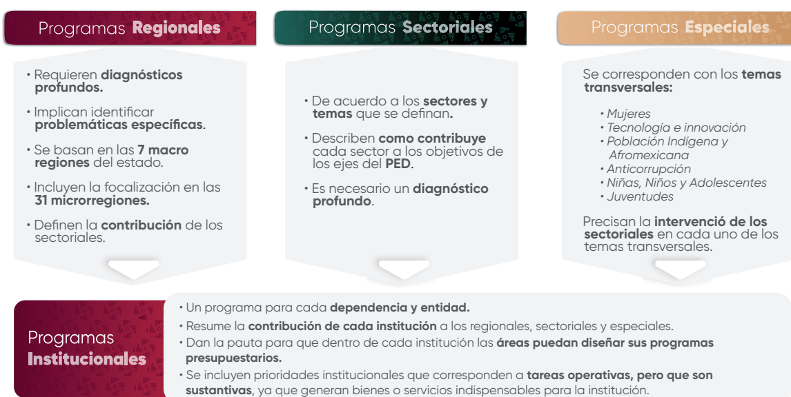
Esquema 1. Estructura de los Programas Institucionales

En el contexto de la planeación táctica del Gobierno del Estado de Puebla para el periodo 2024–2030, los programas institucionales están estructurados a partir de un marco estratégico que incluye: misión, visión, valores, ámbito funcional y componentes estratégicos. Estos componentes definen la participación de las instituciones en los Programas Regionales, Sectoriales y Especiales , (Véase Esquema 1), los cuales son instrumentos clave para la implementación de las políticas públicas estatales. Dichos programas están alineados con el Plan Estatal de Desarrollo del Gobierno del Estado de Puebla 2024–2030 (PED), y tienen como propósito orientar la acción gubernamental mediante objetivos, estrategias, líneas de acción e indicadores y metas medibles, enfocados en atender las necesidades prioritarias de la población.