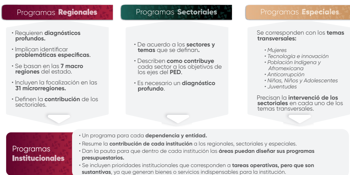
Esquema 1. Estructura de los Programas Institucionales

En el contexto de la planeación táctica del Gobierno del Estado de Puebla para el periodo 2024–2030, los programas institucionales están estructurados a partir de un marco estratégico que incluye: misión, visión, valores, ámbito funcional y componentes estratégicos. Estos componentes definen la participación de las instituciones en los Programas Regionales, Sectoriales y Especiales , (Véase Esquema 1), los cuales son instrumentos clave para la implementación de las políticas públicas estatales. Dichos programas están alineados con el Plan Estatal de Desarrollo del Gobierno del Estado de Puebla 2024–2030 (PED), y tienen como propósito orientar la acción gubernamental mediante objetivos, estrategias, líneas de acción e indicadores y metas medibles, enfocados en atender las necesidades prioritarias de la población.