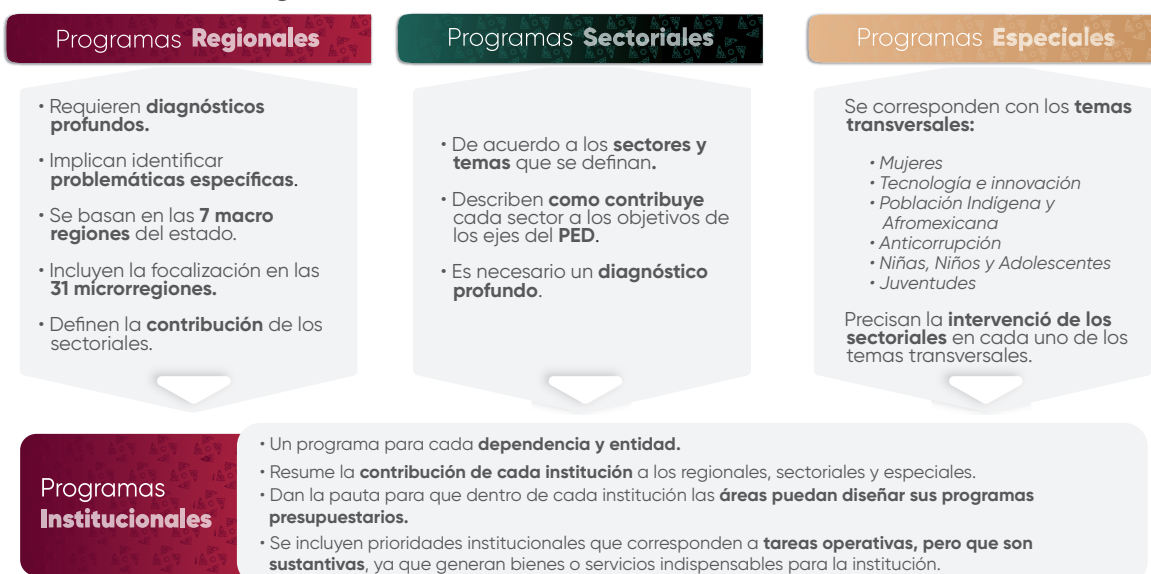
Esquema 1. Estructura de los Programas Institucionales

En el contexto de la planeación táctica del Gobierno del Estado de Puebla para el periodo 2024–2030, los programas institucionales están estructurados a partir de un marco estratégico que incluye: misión, visión, valores, ámbito funcional y componentes estratégicos. Estos componentes definen la participación de las instituciones en los Programas Regionales, Sectoriales y Especiales , (Véase Esquema 1), los cuales son instrumentos clave para la implementación de las políticas públicas estatales. Dichos programas están alineados con el Plan Estatal de Desarrollo del Gobierno del Estado de Puebla 2024–2030 (PED), y tienen como propósito orientar la acción gubernamental mediante objetivos, estrategias, líneas de acción e indicadores y metas medibles, enfocados en atender las necesidades prioritarias de la población.