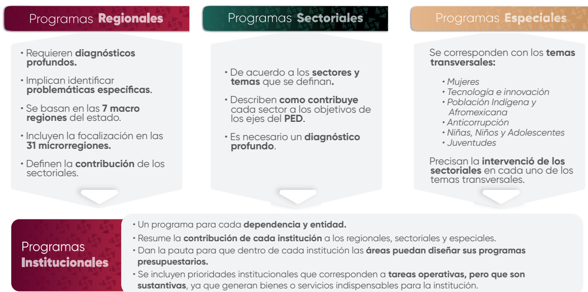
Esquema 1. Estructura de los Programas Institucionales

En el contexto de la planeación táctica del Gobierno del Estado de Puebla para el periodo 2024–2030, los programas institucionales están estructurados a partir de un marco estratégico que incluye: misión, visión, valores, ámbito funcional y componentes estratégicos. Estos componentes definen la participación de las instituciones en los Programas Regionales, Sectoriales y Especiales , (Véase Esquema 1), los cuales son instrumentos clave para la implementación de las políticas públicas estatales. Dichos programas están alineados con el Plan Estatal de Desarrollo del Gobierno del Estado de Puebla 2024–2030 (PED), y tienen como propósito orientar la acción gubernamental mediante objetivos, estrategias, líneas de acción e indicadores y metas medibles, enfocados en atender las necesidades prioritarias de la población.