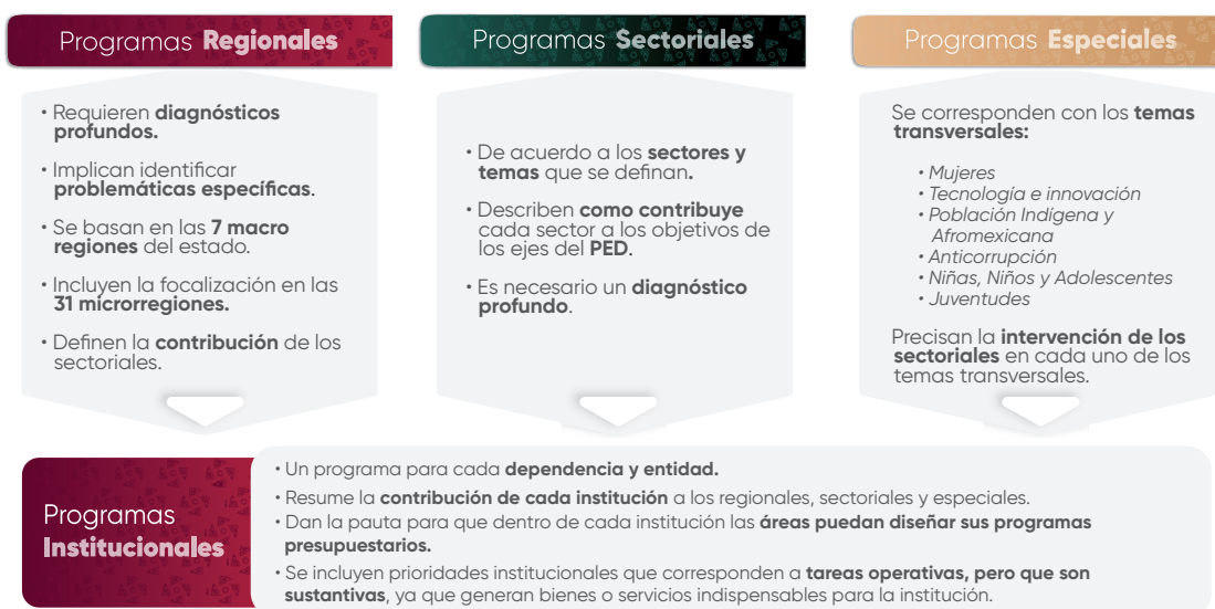
Esquema 1. Estructura de los Programas Institucionales

En el contexto de la planeación táctica del Gobierno del Estado de Puebla para el periodo 2024–2030, los programas institucionales están estructurados a partir de un marco estratégico que incluye: misión, visión, valores, ámbito funcional y componentes estratégicos. Estos componentes definen la participación de las instituciones en los Programas Regionales, Sectoriales y Especiales , (Véase Esquema 1 ), los cuales son instrumentos clave para la implementación de las políticas públicas estatales. Dichos programas están alineados con el Plan Estatal de Desarrollo del Gobierno del Estado de Puebla 2024–2030 (PED), y tienen como propósito orientar la acción gubernamental mediante objetivos, estrategias, líneas de acción e indicadores y metas medibles, enfocados en atender las necesidades prioritarias de la población.