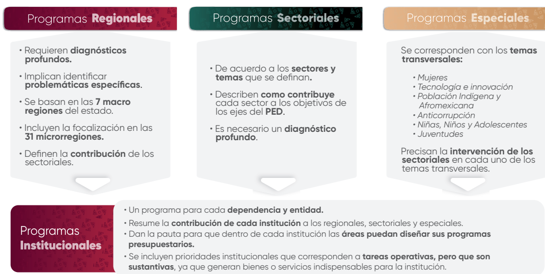
Esquema 1. Estructura de los Programas Institucionales

En el contexto de la planeación táctica del Gobierno del Estado de Puebla para el periodo 2024–2030, los programas institucionales están estructurados a partir de un marco estratégico que incluye: misión, visión, valores, ámbito funcional y componentes estratégicos. Estos componentes definen la participación de las instituciones en los Programas Regionales, Sectoriales y Especiales , (Véase Esquema 1 ), los cuales son instrumentos clave para la implementación de las políticas públicas estatales. Dichos programas están alineados con el Plan Estatal de Desarrollo del Gobierno del Estado de Puebla 2024–2030 (PED), y tienen como propósito orientar la acción gubernamental mediante objetivos, estrategias, líneas de acción e indicadores y metas medibles, enfocados en atender las necesidades prioritarias de la población.