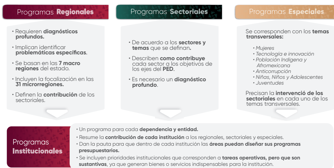
Esquema 1. Estructura de los Programas Institucionales

En el contexto de la planeación táctica del Gobierno del Estado de Puebla para el periodo 2024–2030, los programas institucionales están estructurados a partir de un marco estratégico que incluye: misión, visión, valores, ámbito funcional y componentes estratégicos. Estos componentes definen la participación de las instituciones en los Programas Regionales, Sectoriales y Especiales , (Véase Esquema 1 ), los cuales son instrumentos clave para la implementación de las políticas públicas estatales. Dichos programas están alineados con el Plan Estatal de Desarrollo del Gobierno del Estado de Puebla 2024–2030 (PED), y tienen como propósito orientar la acción gubernamental mediante objetivos, estrategias, líneas de acción e indicadores y metas medibles, enfocados en atender las necesidades prioritarias de la población.