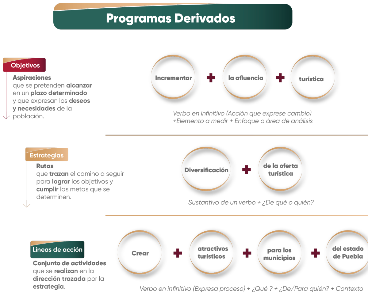
Esquema 3. Sintaxis para la Redacción de los Nuevos Componentes Estratégicos

3.1 Si la respuesta es afirmativa: Se analizará si la línea de acción faltante puede ser vinculada a algún objetivo y/o estrategia ya existente en los Programas Sectoriales y Especiales. Si no es posible establecer dicha correspondencia, la institución deberá desarrollar un árbol de problemas y soluciones, con el fin de sustentar la integración de nuevos componentes estratégicos, asegurando su inserción dentro del marco estructural establecido (Eje, Temática, Objetivo, Estrategia, Línea de Acción, Indicador y Meta). En todo momento deberá conservarse la consistencia estratégica y aplicar la siguiente sintaxis para la redacción de los nuevos componentes estratégicos (Véase Esquema 3).