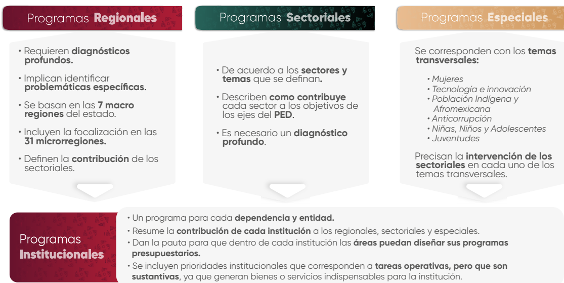
Esquema 1. Estructura de los Programas Institucionales

En el contexto de la planeación táctica del Gobierno del Estado de Puebla para el periodo 2024–2030, los programas institucionales están estructurados a partir de un marco estratégico que incluye: misión, visión, valores, ámbito funcional y componentes estratégicos. Estos componentes definen la participación de las instituciones en los Programas Regionales, Sectoriales y Especiales , (Véase Esquema 1 ), los cuales son instrumentos clave para la implementación de las políticas públicas estatales. Dichos programas están alineados con el Plan Estatal de Desarrollo del Gobierno del Estado de Puebla 2024–2030 (PED), y tienen como propósito orientar la acción gubernamental mediante objetivos, estrategias, líneas de acción e indicadores y metas medibles, enfocados en atender las necesidades prioritarias de la población.