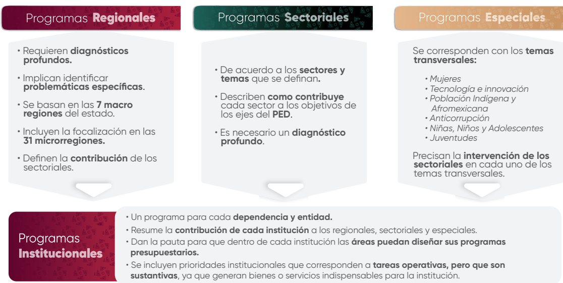
Esquema 1. Estructura de los Programas Institucionales

En el contexto de la planeación táctica del Gobierno del Estado de Puebla para el periodo 2024–2030, los programas institucionales están estructurados a partir de un marco estratégico que incluye: misión, visión, valores, ámbito funcional y componentes estratégicos. Estos componentes definen la participación de las instituciones en los Programas Regionales, Sectoriales y Especiales , (Véase Esquema 1 ), los cuales son instrumentos clave para la implementación de las políticas públicas estatales. Dichos programas están alineados con el Plan Estatal de Desarrollo del Gobierno del Estado de Puebla 2024–2030 (PED), y tienen como propósito orientar la acción gubernamental mediante objetivos, estrategias, líneas de acción e indicadores y metas medibles, enfocados en atender las necesidades prioritarias de la población.