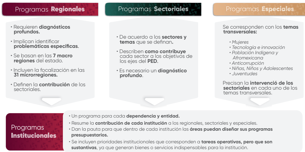
Esquema 1. Estructura de los Programas Institucionales

En el contexto de la planeación táctica del Gobierno del Estado de Puebla para el periodo 2024–2030, los programas institucionales están estructurados a partir de un marco estratégico que incluye: misión, visión, valores, ámbito funcional y componentes estratégicos. Estos componentes definen la participación de las instituciones en los Programas Regionales, Sectoriales y Especiales , (Véase Esquema 1 ), los cuales son instrumentos clave para la implementación de las políticas públicas estatales. Dichos programas están alineados con el Plan Estatal de Desarrollo del Gobierno del Estado de Puebla 2024–2030 (PED), y tienen como propósito orientar la acción gubernamental mediante objetivos, estrategias, líneas de acción e indicadores y metas medibles, enfocados en atender las necesidades prioritarias de la población.