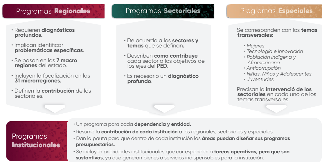
Esquema 1. Estructura de los Programas Institucionales

En el contexto de la planeación táctica del Gobierno del Estado de Puebla para el periodo 2024–2030, los programas institucionales están estructurados a partir de un marco estratégico que incluye: misión, visión, valores, ámbito funcional y componentes estratégicos. Estos componentes definen la participación de las instituciones en los Programas Regionales, Sectoriales y Especiales , (Véase Esquema 1 ), los cuales son instrumentos clave para la implementación de las políticas públicas estatales. Dichos programas están alineados con el Plan Estatal de Desarrollo del Gobierno del Estado de Puebla 2024–2030 (PED), y tienen como propósito orientar la acción gubernamental mediante objetivos, estrategias, líneas de acción e indicadores y metas medibles, enfocados en atender las necesidades prioritarias de la población.