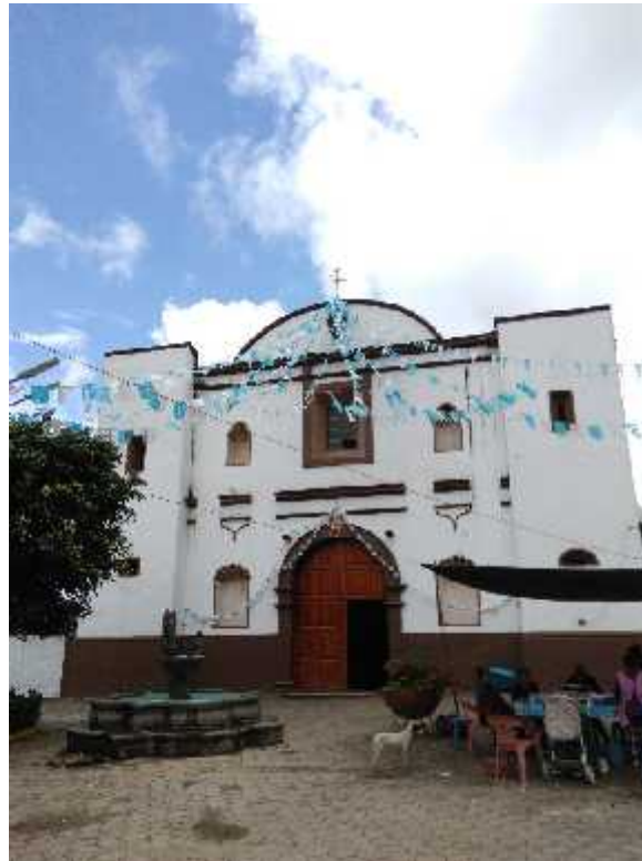
Fotografía: Parroquia de María Santísima, Cabecera Municipal Tepetzintla, Puebla, 2018

Fiestas Populares; el 15 de agosto, celebración de la fiesta patronal con procesiones y danza. También celebran con mucha grandiosidad el Jueves de Corpus. Esta festividad se realiza en la Cabecera.