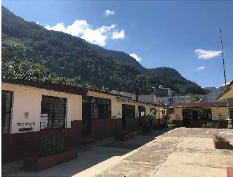
Fotografía: Escuela Primaria Bilingüe “Emiliano Zapata”, Cabecera Municipal Tepetzintla, Puebla, 2018.

De acuerdo a los datos recopilados por la SEP en el año 2010, el estado de alumnos inscritos y egresados en los niveles básicos y medio superior, en el municipio de Tepetzintla, se conformaron de la siguiente manera: