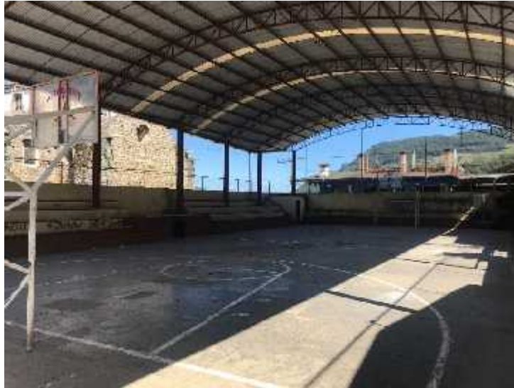
Fotografía: Cancha Escuela Primaria Bilingüe “Emiliano Zapata”, Cabecera Municipal Tepetzintla, Puebla, 2018