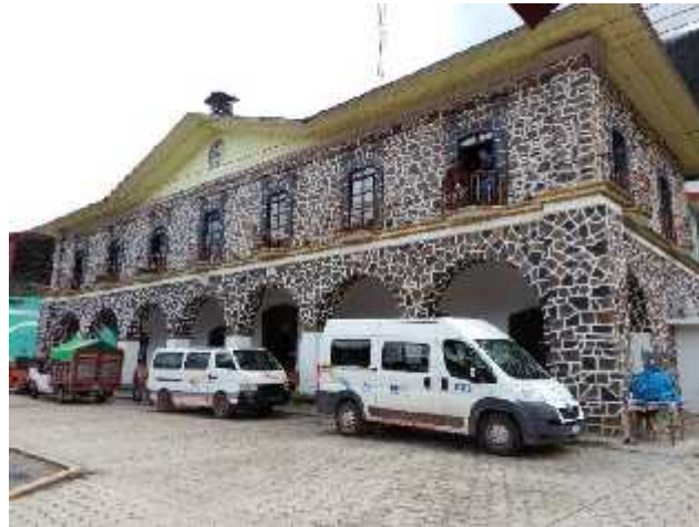
Fotografía: Edificio del H. Ayuntamiento Municipal Cabecera Municipal Tepetzintla, Puebla, 2018