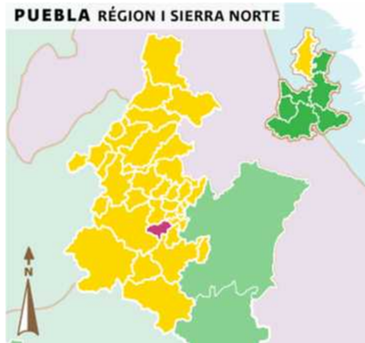
Ilustración: Ubicación del municipio de Tepetzintla en la Región