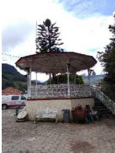
Fotografía: Kiosco en el Zócalo, Cabecera Municipal Tepetzintla, Puebla, 2018