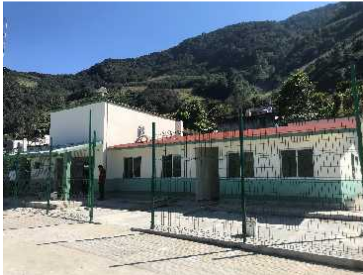
Fotografía: Unidad Médica Rural UMR IMSS Tepetzintla, Cabecera Municipal Tepetzintla, Puebla, 2018

También se cuenta con Casas de Salud que son atendidas por un médico de cabecera todos los días, cuentan con servicios básicos como lo son consultas y son controlados por los servicios de Salud del Estado de Puebla, ubicándose en las siguientes localidades: