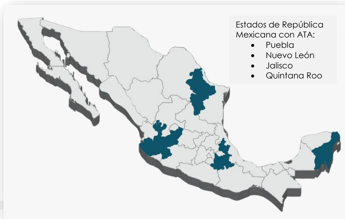
Ilustración1. Estados de la República Mexicana que cuentan con Anexo Transversal Anticorrupción.