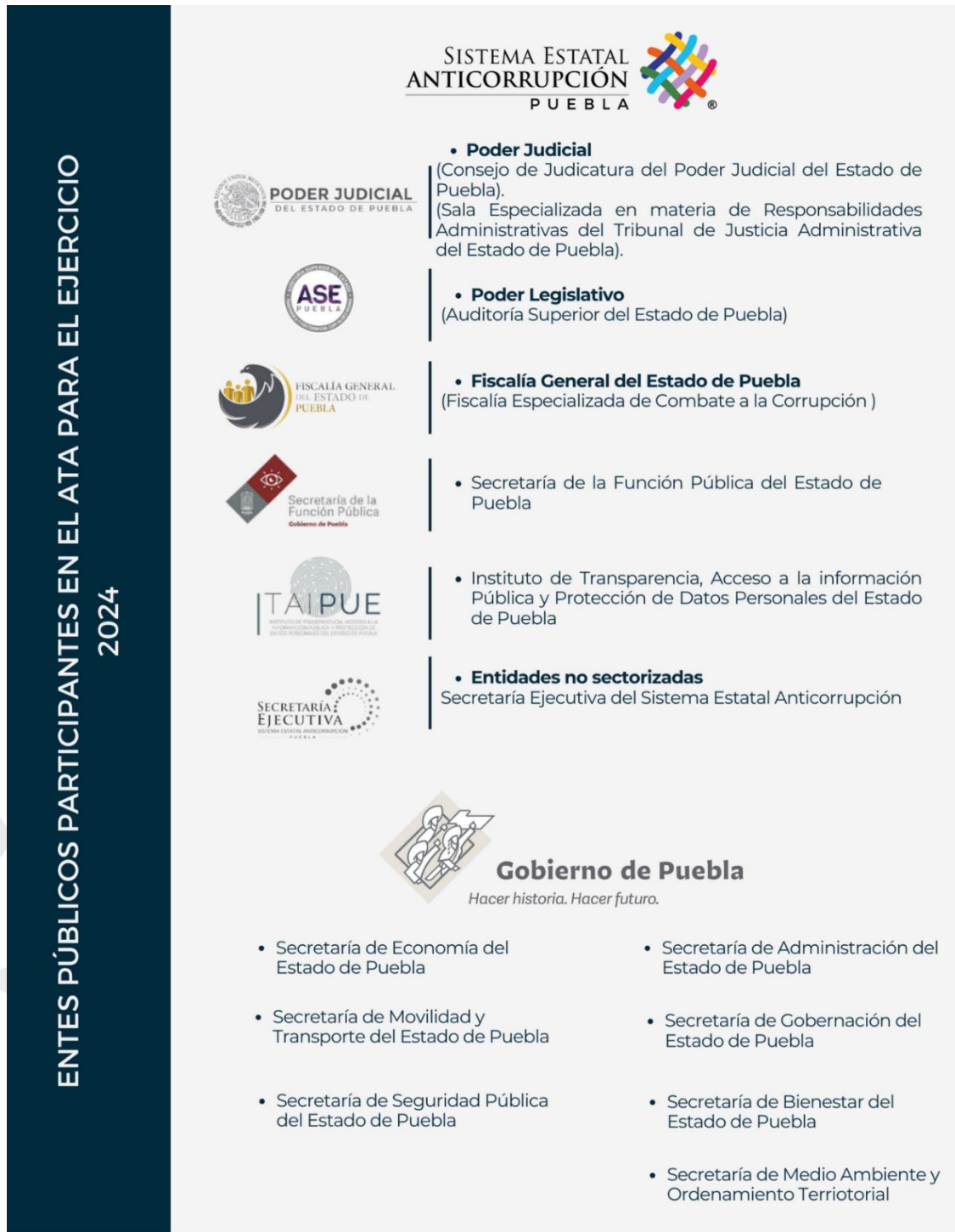
Ilustración 3. Entes públicos participantes en el ATA, de acuerdo con la Ley de Egresos del Estado de Puebla para el ejercicio 2024