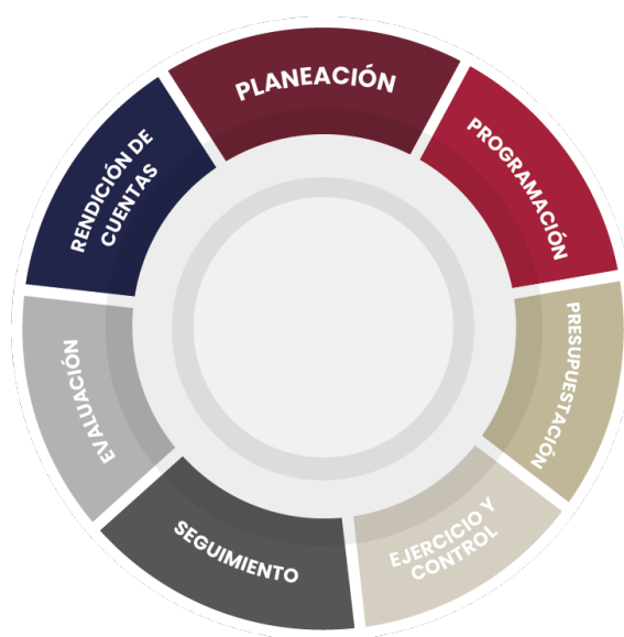
Esquema 4.1. Etapas del Ciclo Presupuestario