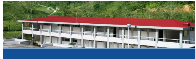
Segunda etapa de construcción de talleres y laboratorios.

En 2013 se concluyó la segunda etapa de construcción de talleres y laboratorios, lo que beneficio a 178 estudiantes y 29 trabajadores.