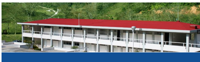
Segunda etapa de construcción de talleres y laboratorios.

En 2013 se concluyó la segunda etapa de construcción de talleres y laboratorios, lo que beneficio a 178 estudiantes y 29 trabajadores.