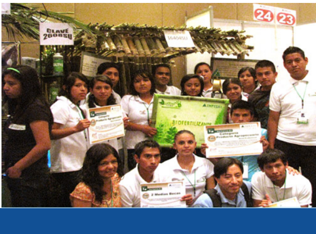
Participantes del Programa IMPULSA

En razón a los resultados obtenidos como mejor producto agropecuario, así como mejor director al participar en el Programa IMPULSA, la UIEPA asistió en 2011 a Brasil y en 2012 a Córdoba Argentina, donde se benefició a dos profesores y dos estudiantes para acercar situaciones reales de aprendizaje y trasladar sus experiencias por medio de conferencias a 150 estudiantes de la universidad.