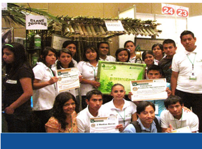
Participantes del Programa IMPULSA

En razón a los resultados obtenidos como mejor producto agropecuario, así como mejor director al participar en el Programa IMPULSA, la UIEPA asistió en 2011 a Brasil y en 2012 a Córdoba Argentina, donde se benefició a dos profesores y dos estudiantes para acercar situaciones reales de aprendizaje y trasladar sus experiencias por medio de conferencias a 150 estudiantes de la universidad.