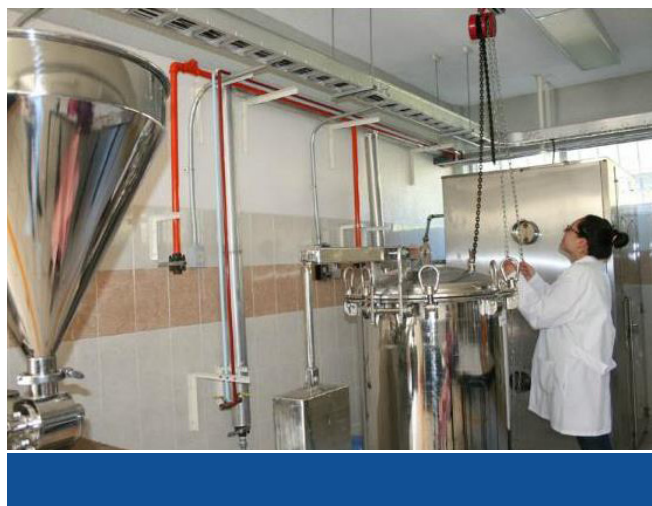
Taller de cárnicos

Los laboratorios y talleres de la UIEPA requieren de otros equipos que complementen y diversifiquen las prácticas de estudio, por lo que se gestiona ante el Comité Administrador para la Construcción de Espacios Educativos (CAPCEE) y la Secretaría de Finanzas y Administración la aplicación de remanentes y ahorros presupuestales para la adquisición de más equipos que faciliten el trabajo académico que se requiere para dar cumplimiento a los programas estudio de la Universidad.